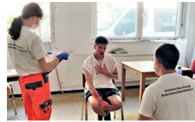
Während der Prüfung

Es ist endlich soweit! Nach coronabedingter Verschiebung der Prüfung konnten unsere angehenden Sanitäterinnen und Sanitäter nun endlich beweisen, was sie drauf haben.