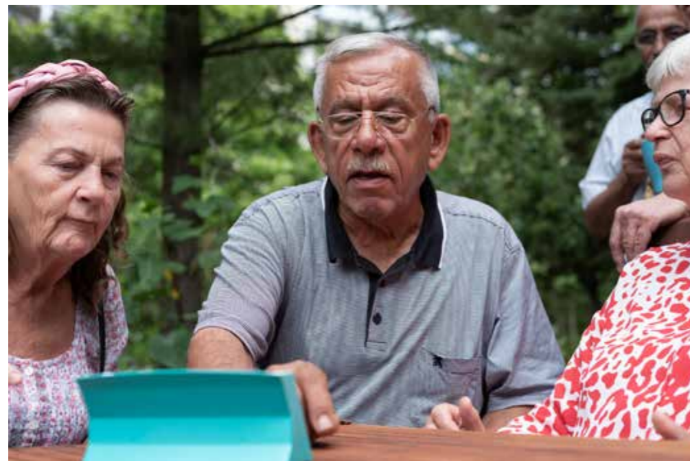
Jeden Mittwoch trifft sich die Spielerunde für Senior*innen im Murtzaner Ring. An heißen Tagen sitzt man im kühlenden Schatten der Gartenbäume.

Engagement und Begegnungen im Stadtteil. Allein im Nachbarschaftszentrum in der Sella-Hasse-Straße finden acht Angebote pro Woche statt. Zusammen mit den Eltern-Kind-Angeboten im Familienzentrum und dem Kinder- und Jugendzentrum ist es das „DRehKreuz“, die Anlaufstelle für alle Nachbarinnen und Nachbarn im Kiez.