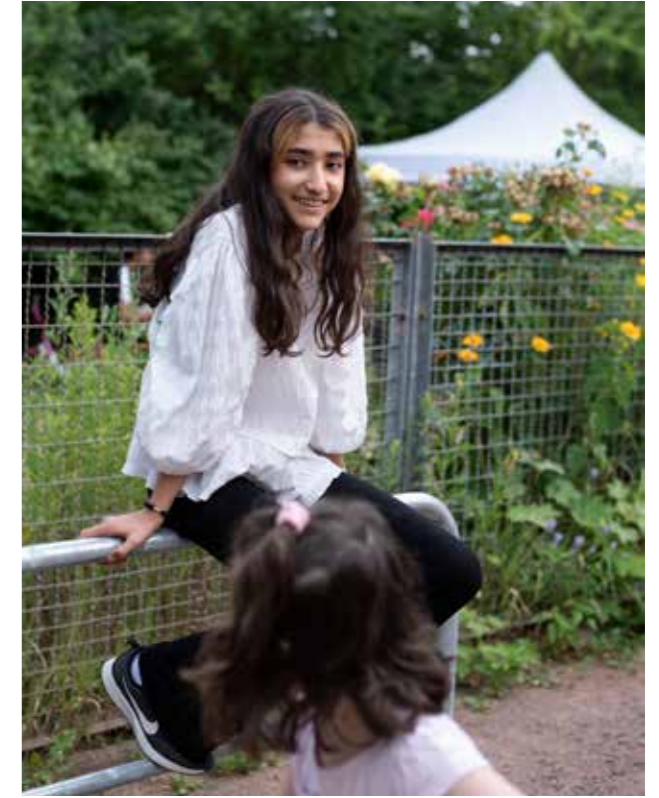
Ein Ort für alle Generationen: während die Eltern im Sprachcafé üben, spielen die Kinder im Garten.

Herzstück des Begegnungszentrums ist jedoch der Gemeinschaftsgarten, eine zum Grundstück gehörende Grünfläche, die die Nachbar*innen in den letzten zwei Jahren in eine kleine Oase verwandelten. Der Einladung zum gemeinschaftlichen Aufbau waren viele Alteingesessene und Bewohner*innen aus den Unterkünften gefolgt. Natürlich gab es Sprachbarrieren und manchmal auch persönliche Skepsis. Doch während sie gemeinsam Bodenplatten verlegten, Hochbeete aufbauten und Gemüse pflanzten, säten sie auch die ersten Keime, die in den letzten Jahren zu Sympathien und Freundschaften heranwuchsen. Heute arbeiten in diesem Garten tagtäglich Menschen Hand in Hand, die sich vielleicht nur holprig miteinander unterhalten können, aber dafür eine Herzensangelegenheit teilen.