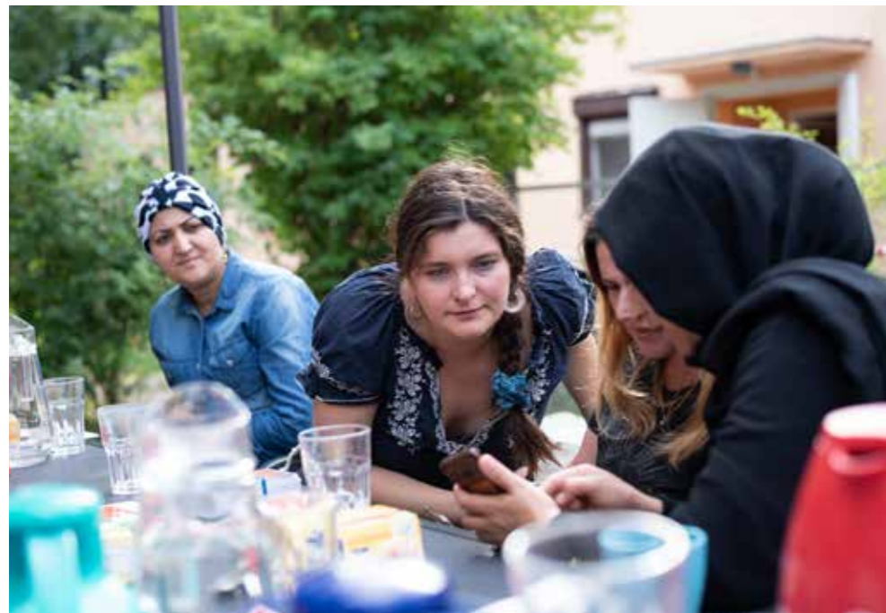
Beim Sprachcafé lernen sich die Besucher*innen gemütlich kennen und üben dabei neue Vokabeln und Grammatik.

Immer wieder tragen diese Beziehungen auch über den Garten hinaus, münden in Einladungen oder gegenseitiger Hilfe. Eine syrische Familie hat durch die Hilfe eines Nachbarn sogar eine Wohnung in der Nähe gefunden.