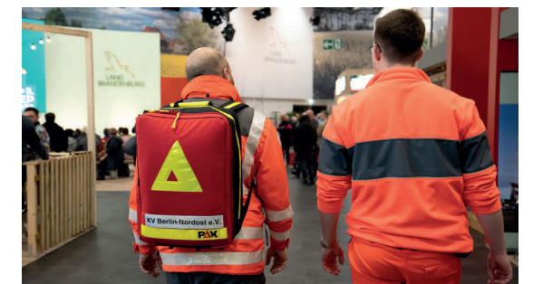
Einsatz während der Grünen Woche.