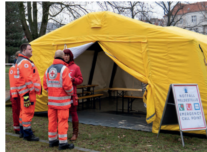
Unsere Ehrenamtlichen im Einsatz.