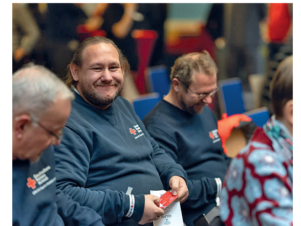
Unsere ehrenamtlichen Helfer:innen.

„Fit für die Straße in Marzahn-Hellersdorf“ hieß die dreitägige interaktive Veranstaltung zur Sucht- und Verkehrsunfallprävention für Marzahner-Hellersdorfer Schülerinnen und Schüler ab der 10. Klasse. Gerade mit dem Einzug von alternativen Mobilitätsangeboten wie E-Scooter und Elektroroller, die mit einer flotten Beschleunigung werben, wird das Risiko der Überschätzung als Teilnehmer:innen im Straßenverkehr erhöht. Junge ehrenamtliche Sanitäter:innen unseres Kreisverbandes stellten wichtige lebensrettende Maßnahmen vor und luden zum Üben ein. Dadurch wurden die Jugendlichen für das Thema Unfallgefahr im Straßenverkehr sensibilisiert und die Notwendigkeit einer Ausbildung zum Ersthelfer thematisiert.