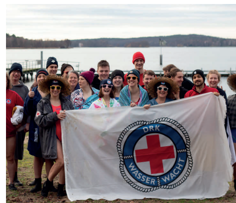
Die Helfer:innen unserer Wasserwacht am Wannsee.

Ehrenamtliche aus den Bereitschaften bieten seit Ende des letzten Jahres den Kurs #Nothilfe an, um diesen Menschen dabei zu helfen, sich auf ein Leben in einer solchen Umgebung vorzubereiten. Es ist wichtig, dass wir sie dabei unterstützen, ihre Fähigkeiten zu entwickeln, um in einer zerstörten Infrastruktur zu rechtzukommen und sich selbst zu versorgen.