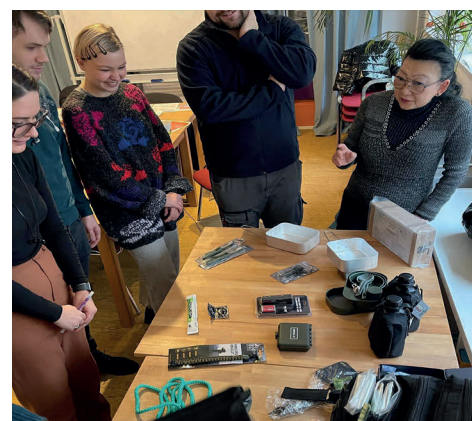
Zusammenpacken eines Notfallrucksacks.