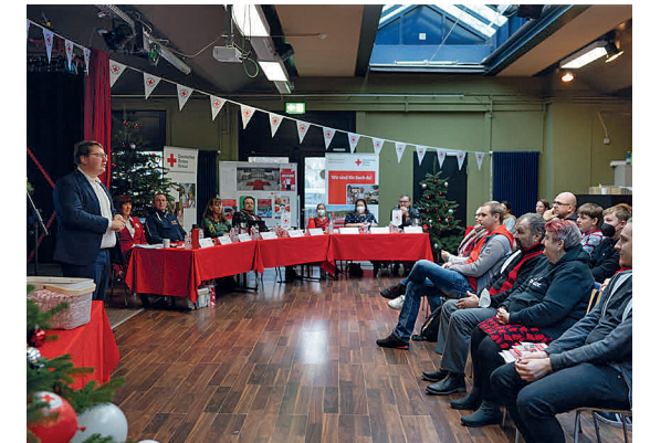
Bericht des Präsidiums.