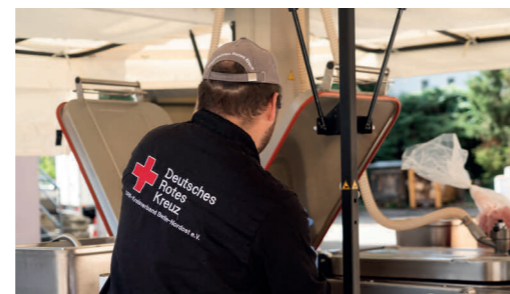
Essenszubereitung für die Einsatzkräfte