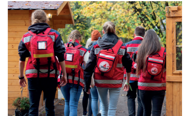
Mitglieder des Jugendrotkreuzes