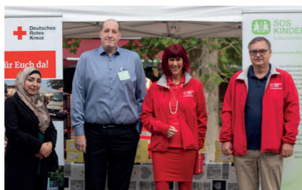
Das SOS-Kinderdorf unterstützt und finanziert unsere Hilfsaktion mit.

Für aktuelle Informationen scannen Sie uns oder rufen Sie uns an: