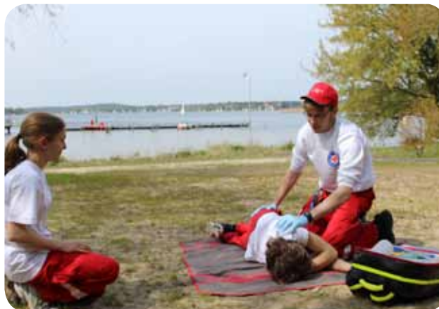
Auch Erste-Hilfe-Leistungen an Land werden regelmäßig benötigt und geübt.