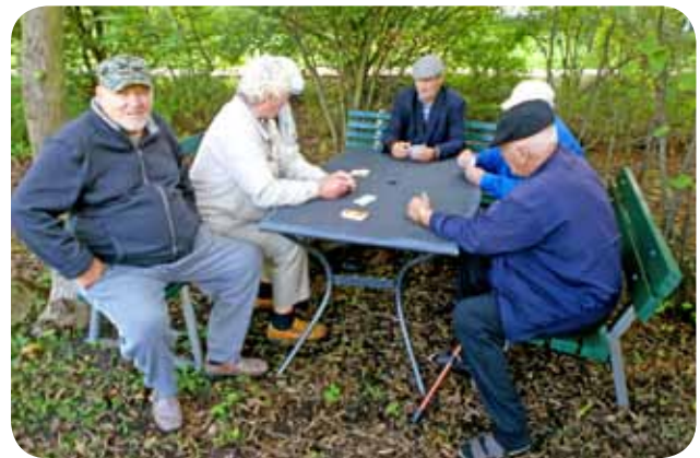
...und bauten ihre eigene Sitzgruppe. Dort spielen sie jetzt regelmäßig Karten.

jüngeren Männern auch über Alkoholmissbrauch und Spielsucht gesprochen werden und eine präventive Arbeit aufgenommen werden, aber dafür müssen die Sozialarbeiter zuerst viel Vertrauen aufbauen.