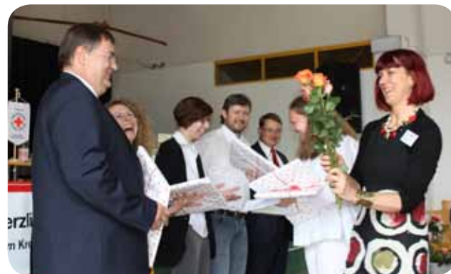
2016 wurde er selbst für seine zehnjährige Mitgliedschaft geehrt.