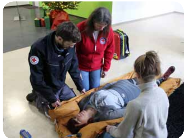
Zu unserem Sanitätsdienstlehrgang kamen Ehrenamtliche aus verschiedenen Kreisverbänden.