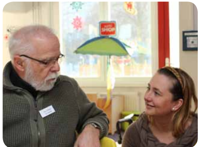
Während des Seniorencafés führten Mitarbeiter und Fördermitglieder angeregte Gespräche.