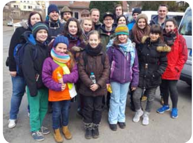
Unsere Gemeinschaftsreise im Frühjahr stärkte den Teamgeist und das gegenseitige Vertrauen.

Unsere Ehrenamtlichen Mitglieder sind in vier verschiedenen Gemeinschaften organisiert, die wir Ihnen auf den folgenden Seiten vorstellen.