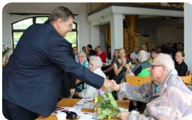
...und engagiert sich im Präsidium, wie hier bei der Ehrung langjähriger Mitglieder.