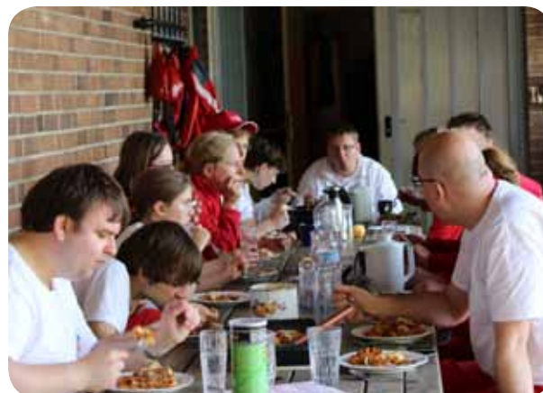
... und gegessen!