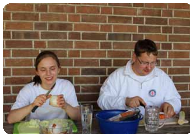
Auf der Station wird gemeinsam gekocht....