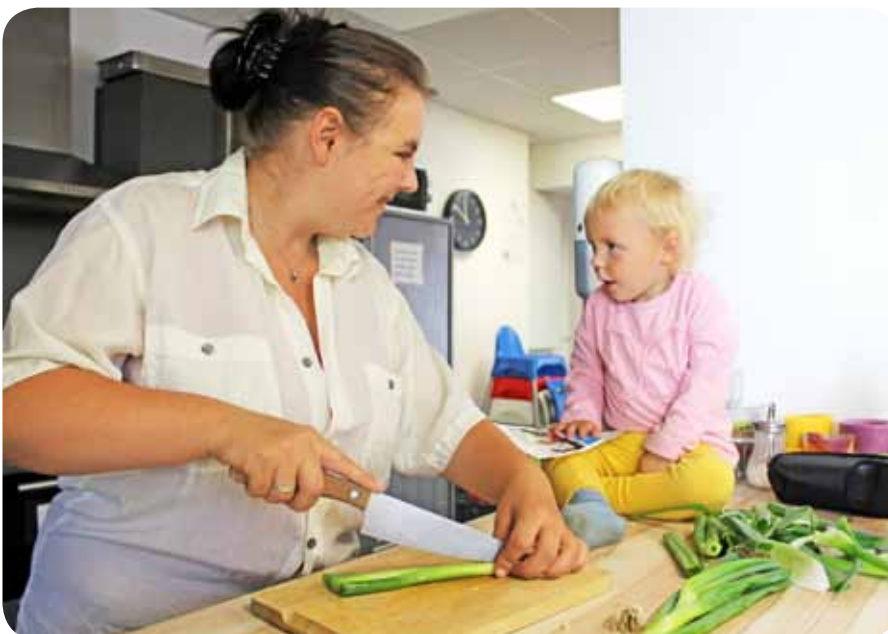
Unsere Koch-AG war wieder sehr aktiv und begeisterte jedes Alter!