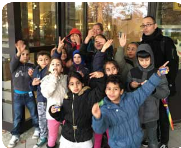
Stammesbesucher und neue Kinder profitierten von gemeinsamen Erlebnissen.

In Zusammenarbeit mit den Mitarbeitern zweier umliegender Unterkünfte begleiteten wir interessierte Familien, Kinder und Jugendliche zu speziellen Einstiegsangeboten. Familien aus Syrien, Afghanistan und dem Irak nutzten regelmäßig das Angebot in unserem Familiencafé, bei dem wir gemeinsam bastelten, spielten, nähten und uns gegenseitig kennen lernten.