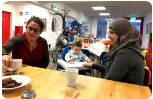
Spiel- und Bastelangebote im Familiencafé weckten Interesse bei Familien mit Kindern.

Ab Februar 2017 sollen unsere Angebote für Geflüchtete mit Mitteln des Berliner Masterplans „Integration und Sicherheit“ erweitert werden.