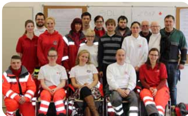
...bei unseren Sanitätsdienstlehrgängen ist er aktiv in der Ausbildung neuer Sanitäter...