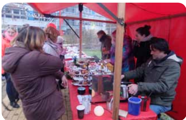
Viele unterschiedliche Menschen kamen zu unserem winterlichen Nachbarschaftsfest.

Die Angebote des neuen Projektes sollen die Menschen im Quartier Mehrower Allee näher zusammen bringen.