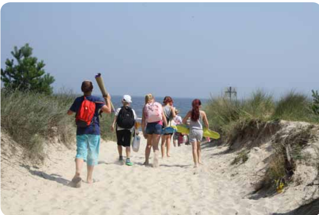
Für viele der Inbegriff von Sommer: Ferien am Meer. Für einige der Tagesgruppen-Kinder die erste Urlaubsfahrt ihres Lebens.

Tagesgruppenjahr. Und dieses Jahr stand auch die Fahrt unter dem Zeichen Stille (aus)halten und Ruhe finden: sechs Tage Usedom, sechs Tage Weite, sechs Tage das Rauschen der Ostsee. Das ist erstmal nicht jedermanns Sache; besonders dann nicht, wenn die alltägliche Weite durch den nächsten Häuser-